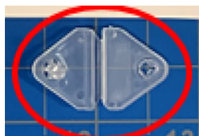
Ny triangelformad knapp

Temperatur 15-35°C Luftfuktighet 40-50% RH